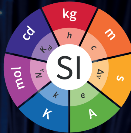
Die sieben Basiseinheiten des Internationalen Einheitensystems (SI)

Die sieben Basiseinheiten des Internationalen Einheitensystems (SI): statt Urmeter und Urkilogramm definieren jetzt fundamentale Naturkonstanten das metrische Einheitensystem. Um in der Physik genaue Messungen durchzuführen sind Messgeräte erforderlich und es werden genormte Einheiten benötigt. Für die Länge wurden früher Einheiten wie Elle, Fuß oder Handspanne genutzt, für die Masse Referenzgegenstände, deren Masse sich aber im Laufe der Zeit geringfügig veränderte. Die Einheit der Zeit (Sekunde) wurde als der 86400. Teil eines mittleren Sonnentages festgelegt, aber auch diese Größe ist Schwankungen unterworfen.