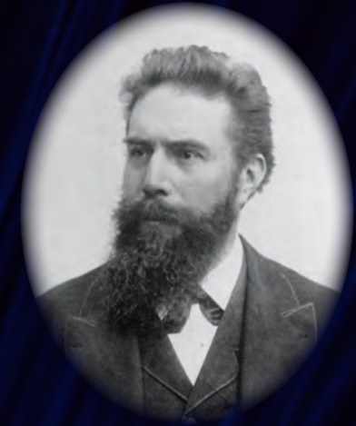
Wilhelm Conrad Röntgen

Die Entdeckung der Röntgenstrahlen 1895 in Würzburg durch Wilhelm Conrad Röntgen hat nicht nur ihrem Namensgeber den ersten Nobelpreis für Physik eingetragen. Über mehr als ein Jahrhundert hinweg bis in die jüngste Vergangenheit hinein wurden immer wieder Forschungsarbeiten in Physik, Chemie und Medizin, die ohne den Einsatz der von Röntgen selbst X-Strahlen genannten Strahlung nicht möglich gewesen wären, mit dem höchsten Wissenschaftspreis ausgezeichnet.